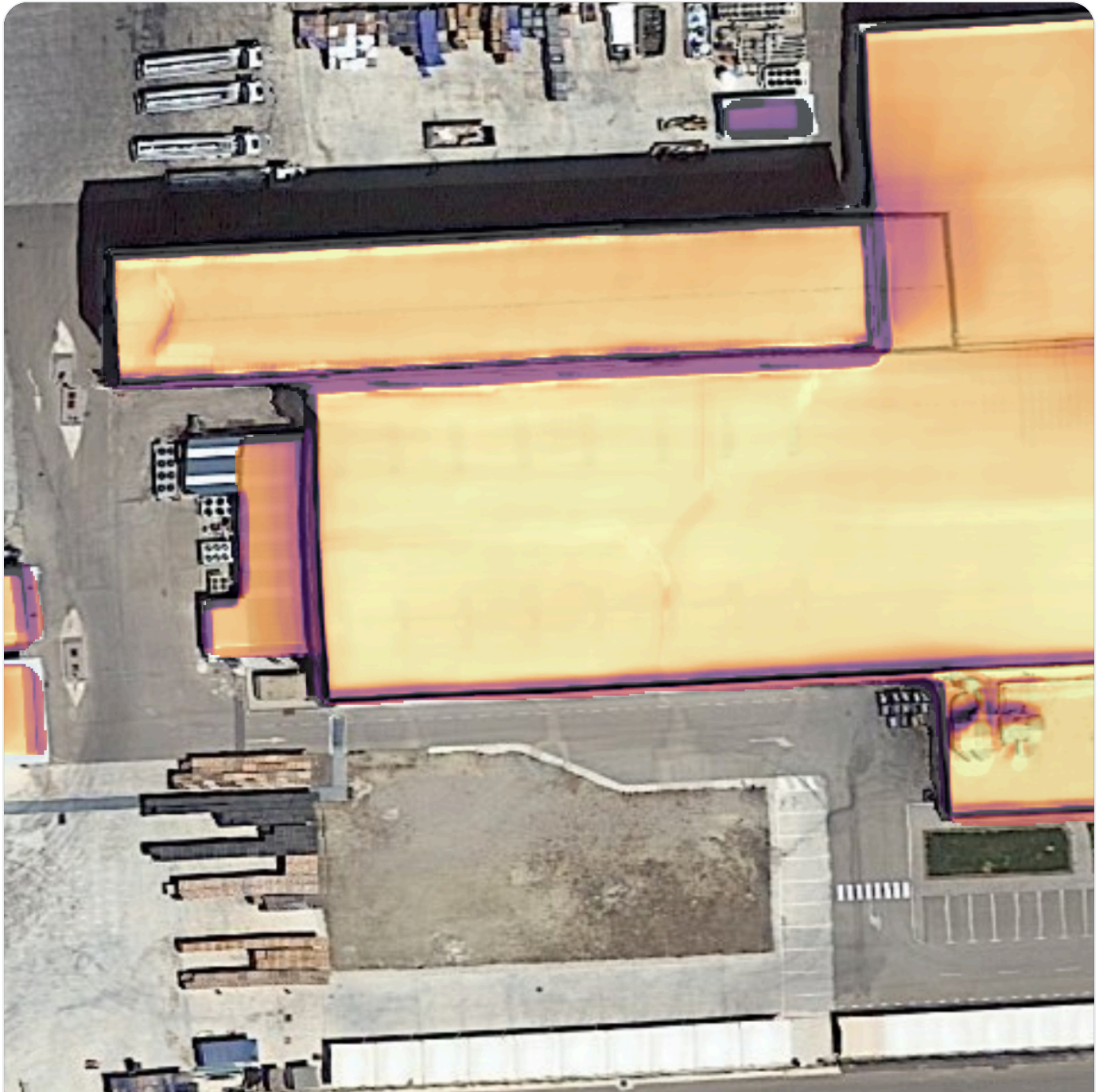
Irradiación anual píxel a píxel sobre la cubierta · base ortofoto PNOA (IGN España, CC BY 4.0)